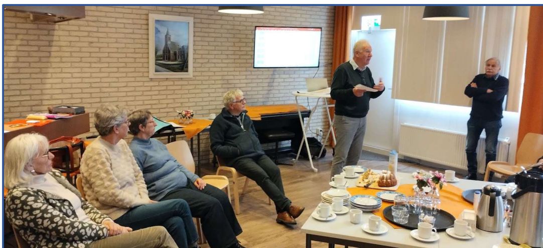
Presentatie jaarcijfers 2023

In januari 2025 zijn de balanstellingen gedaan. Er zijn niet te herleiden telverschillen. Vermoedelijk ontstaan door gebruik van verkeerde barcodes bij het scannen van verkopen. Als penningmeester heb ik besloten de telverschillen in 2025 te boeken.